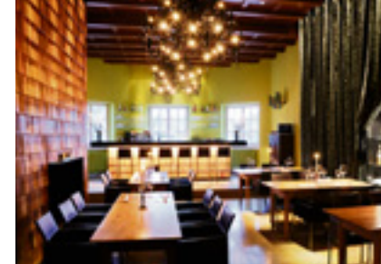
Auch das Ambiente im Hegel Eins (Hegelplatz) wurde von Ghanai entworfen

Fernsehturm-Gastronomie und haben Cyrus mit dem Umbau beauftragt. Die Pläne sind streng geheim. Doch der Star-Architekt verrät: „Es ist ein ganz neues Konzept!“ Tagsüber ist die gläserne Kanzel ein modernes, helles Café für Tou-